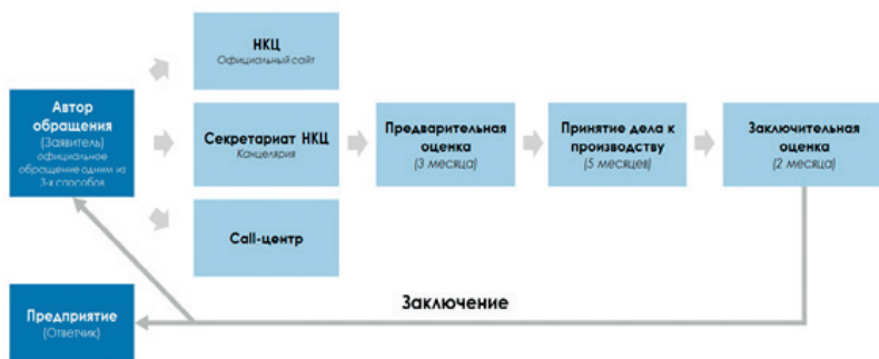
Рисунок 3. Порядок рассмотрения обращений о нарушениях Руководящих принципов ОЭСР

1. Разработаны и утверждены на первом заседании НКЦ 25 августа 2020 года решением № 1 Правила рассмотрения обращений о нарушениях Руководящих принципов ОЭСР. В целом, порядок подачи обращения и их рассмотрения выглядят следующим образом (Рисунок 3).