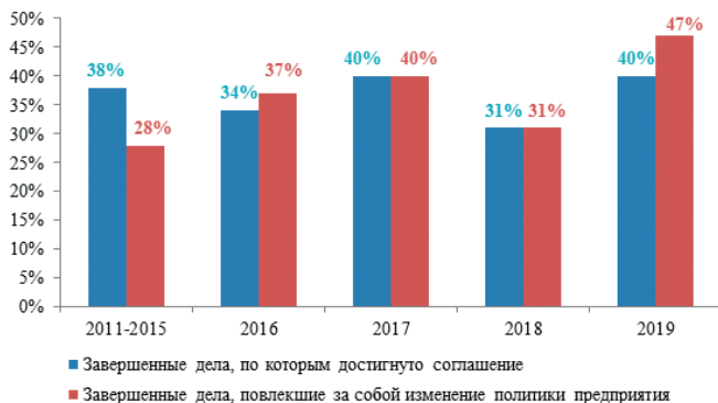
Рисунок 2. Результаты, достигнутые НКЦ за период с 2011-2019 годы

Источник: https://mneguidelines.oecd.org/database/