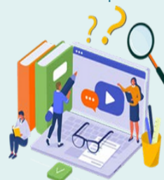
Онлайн-академия ОЭСР по ответственному ведению бизнеса

Центр ОЭСР по ответственному ведению бизнеса осуществляет аналитическую деятельность, поддерживает страны в наращивании потенциала и разработке стандартов, а также способствует межправительственному сотрудничеству в области ответственного ведения бизнеса. Центр разрабатывает инструменты и руководства, проводит исследования, поддерживает работу Национальных контактных центров и обеспечивает согласованность политики государств-участников. Его деятельность направлена на то, чтобы предприятия, правительства и заинтересованные стороны могли согласовывать свои практики с международно признанными нормами ответственного ведения бизнеса и целями устойчивого развития.