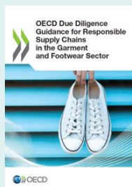
Руководство ОЭСР по должной осмотрительности в сфере ответственного ведения цепочек поставок в секторе одежды и обуви