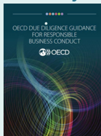
Руководство ОЭСР по должной осмотрительности в сфере ответственного ведения бизнеса