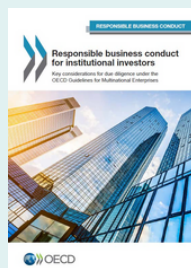
Руководство по ответственному ведению бизнеса для институциональных инвесторов