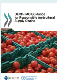
Руководство ОЭСР и ФАО по ответственному ведению сельскохозяйственных цепочек поставок