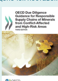
Руководство ОЭСР по должной осмотрительности в сфере ответственного ведения цепочек поставок минералов из затронутых конфликтами и высокорисковых районов