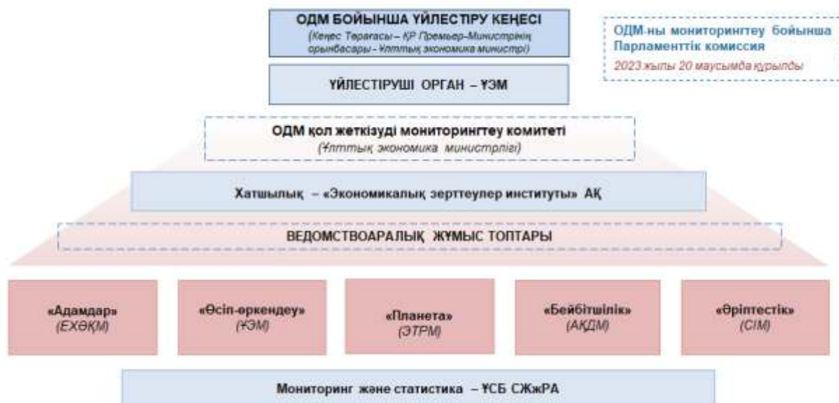
Сурет 3. Қазақстанда ОДМ іске асырудың институционалдық негізі

2023 жылғы 20 маусымда Орнықты даму саласындағы ұлттық мақсаттар мен міндеттердің іске асырылуын мониторингтеу жөніндегі Парламенттік Комиссия құрылды. Экономикалық зерттеулер институты Комиссиямен белсенді ынтымақтасады, сараптамалық-талдамалық қолдау көрсетеді.